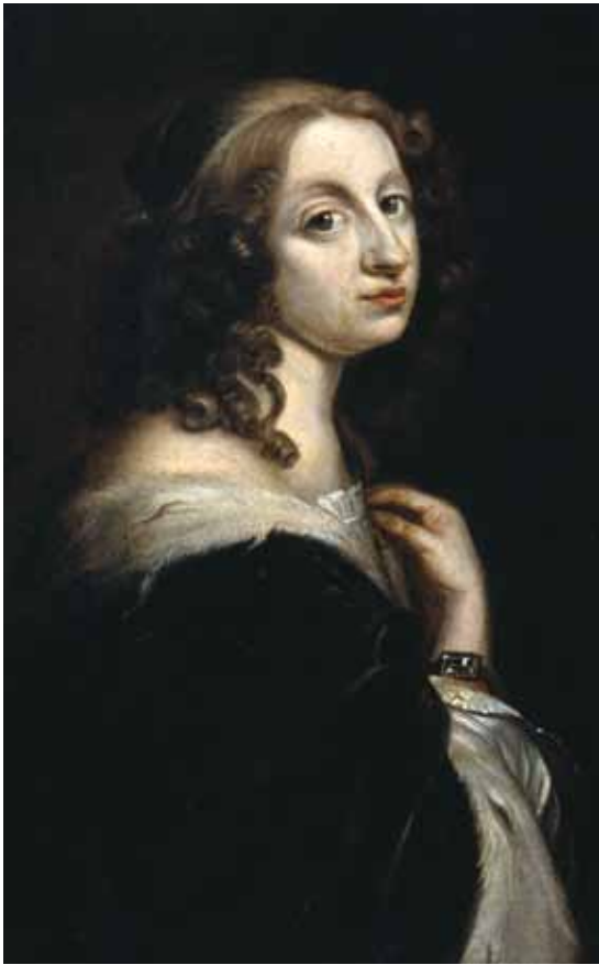
Drottning Kristina (1626–1689) Porträttet av drottning Kristina från 1647, när hon var 21 år gammal, är målat av den holländske konstnären David Beck.