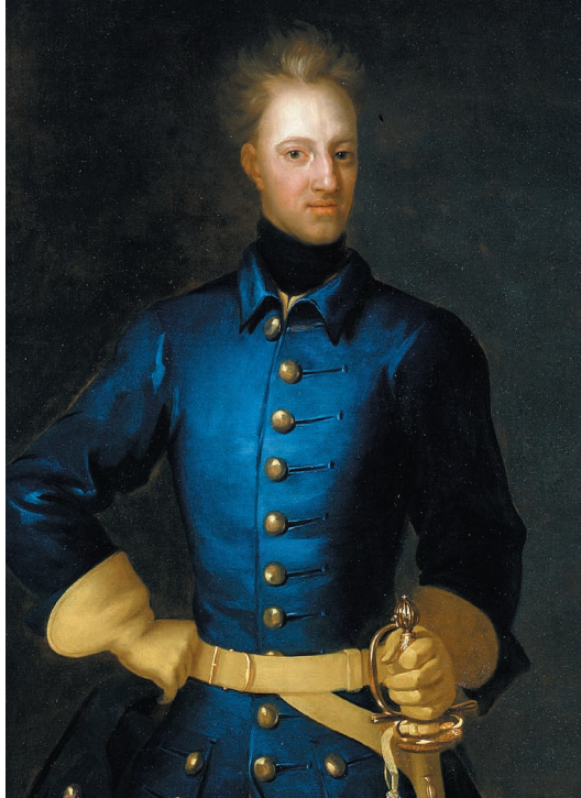
Karl XII. Oljemålning av David Schwartz, 1707.

Karl kröntes till kung då han var 15 år. Riksdagen tyckte att han var tillräckligt mogen – trots att han inte var myndig. Karl XII satte kungakronan själv på sitt huvud. Enväldet, att kungen själv bestämde allt, hade införts av Karl XII:s pappa. När Karl XII blev kung var han ansvarig för det han gjorde endast inför Gud.