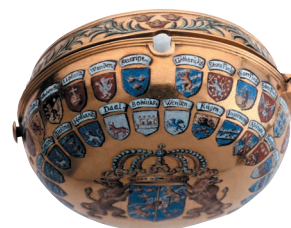
Karl XII:s klocka.

Sadeln är från början av 1700-talet. Den är av gul sammet och har smala silvergaloner. Kåporna är av läder, och sadelknappen är försilvrad. Schabraket, hästtacket, är av blå sammet med kungens krönta monogram, galoner och broderi i guld.