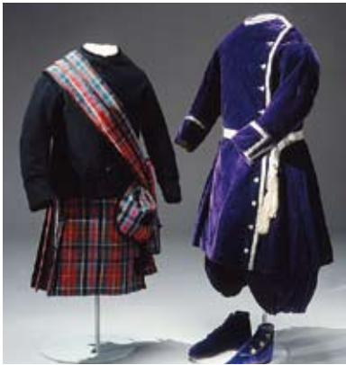
Drottning Sofia (1836–1913) med sina två äldsta söner, Gustaf och Oscar.

När prinsessan Sofia mottogs av folkets jubel i Stockholm den 19 juni 1857 vid prins Oscar sida kom hon klädd i blå klänning med svandun. Därför kallades hon ”den blå hertiginnan”. Hon hade då redan läst på sitt nya hemlands historia och lärt sig tala svenska och norska.