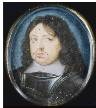
KARL X GUSTAV

Årets nationaldagsfirande i Livrustkammaren, som i vanlig ordning utgjorde en del av "Öppet slott", d.v.s. nationaldagsfirandet på Stockholms slott, var ett i alla avseende lyckat evenemang. Inte mindre än 4 413 personer i alla åldrar besökte museet. Det räckte inte till att slå det gamla rekordet från 2009 (7 076 besökare), men var ändå betydligt bättre än förra årets siffror (3 648). Trots att det stundtals var rejält trångt i delar av museet var stämningen god. Säkert bidrog det strålände vädret därtill men också det rika programutbud som besökarna bjöds på. I undertecknads specialvisning "Dynastin Bernadotte i kultur och politik – från Karl XIV Johan till Carl XVI Gustaf" deltog c:a 50 intresserade besökare. Även barnvisningarna (2 st.) "Vad gömmer sig i Slottets källare" var mycket uppskattade, liksom riddardubbningen i Stensalen. Även två visningar av specialutställningen "Kunglig vintage" var välbesökta. I år var det anmärkningsvärt många utländska turister som hade hittat till Livrustkammaren och dessa kunde förutom att nyttja audioguiden också delta i en visning av museet på engelska.