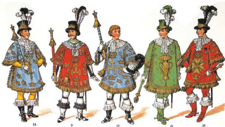
SVENSKA HÄROLDER (UR THE ART OF HERALDRY AV FOX-DAVIES, PL II) FRÅN V. TILL H. HÄROLD VID SVÄRDSORDEN (BLÅ) RIKSHÄROLDEN (PURPUR), HÄROLD VID KGL. MAJ:TS ORDEN (RÖD), HÄROLD VID VASAORDEN (GRÖN) & HÄROLD VID NORDSTJÄRNEORDEN (RÖD).

Efter visningen serveras lättare förtäring samt ett glas vin. Lokal meddelas i senare medlemsblad.